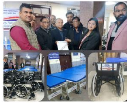
Post Views 351